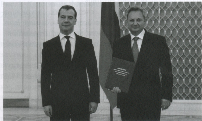
Рис. 1. 25 октября 2012 года, Москва. Председатель Правительства РФ Дмитрий Медведев и ректор Ставропольского государственного аграрного университета Владимир Трухачев после церемонии вручения диплома и награды лауреата премии Правительства РФ в области качества 2011 года

ВТОРЫМ ШАГОМ стало прохождение вузом в 2006 году международного сертификационного аудита и получение международных сертификатов системы менеджмента качества (EVROSERT, ÖQS, IQNet).