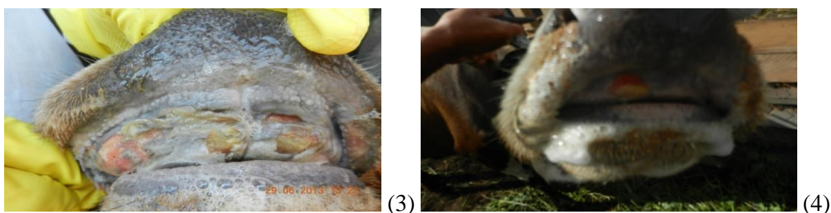
Рисунок 3, 4 – Поражение ротовой полости (3) и саливация (4) у коровы при ящуре