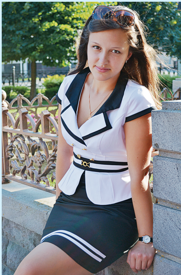
«...НУЖНО ТОЛЬКО НЕ БЕЗДЕЙСТВОВАТЬ, А ДОБИВАТЬСЯ УСПЕХА»

Отбор осуществлялся в два этапа. Первый этап проходил ещё в ноябре 2012 года, тогда отбирались студенты с хорошими теоретическими знаниями и навыками практической работы в области сельского хозяйства. Данный этап я с успехом прошла и приня-