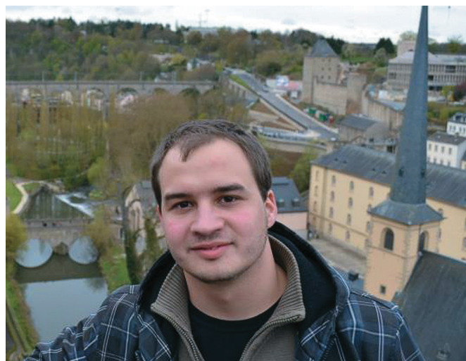
НЕИЗГЛАДИМЫЕ ВПЕЧАТЛЕНИЯ ЧЕШСКОГО МАГИСТРА